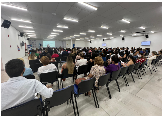
EPRT reuniu cerca de 300 enfermeiros e enfermeiras responsáveis técnicos para atualização

Enfermeiros que exercem função de responsáveis técnicos se reuniram, em abril, no auditório da Faculdade Imaculada Conceição do Recife, para discutir e reforçar a importância da atividade para o bom funcionamento dos serviços de saúde. O Encontro Pernambucano de Responsáveis Técnicos de Enfermagem (EPRT), promovido pelo Sistema Educacional Lavoisier, do Conselho Regional de Enfermagem de Pernambuco (Coren-PE), contou com palestras e homenagens aos profissionais que se destacaram. Representantes de outras regionais também compareceram ao evento.