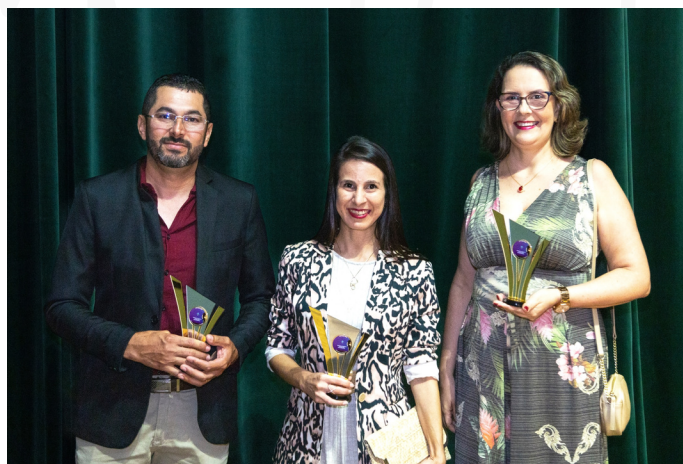
Prêmio Ivanete Alves do Nascimento homenageou profissionais que se destacaram durante o ano