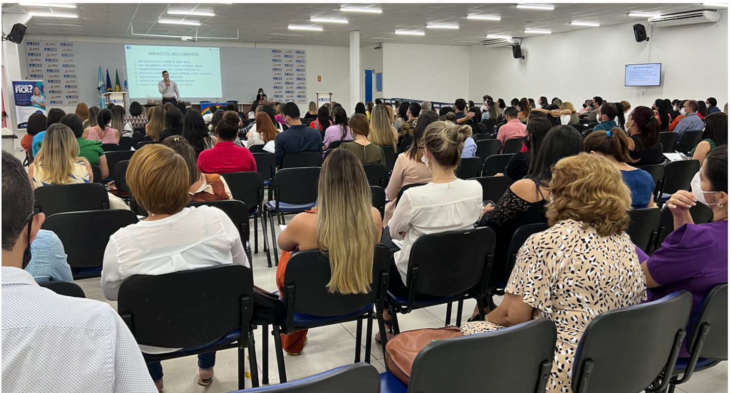
Encontro aconteceu no auditório da Faculdade Imaculada Conceição do Recife, na Av. Caxangá