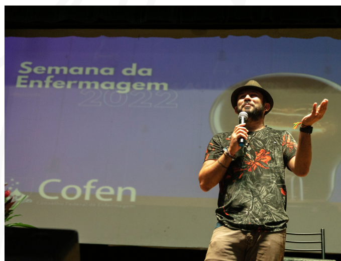
O poeta popular, Bráulio Bessa, brilhou na noite com a palestra “Poesia que Transforma”

Durante a abertura, o cearense Bráulio Bessa apresentou a palestra “Poesia que transforma”, com histórias que inspiram as pessoas a mudar de vida. “O caminho tem espinho, pedra, buraco, pra atrasar a gente. Não desanime por nada, pois até uma topada empurra você pra frente”, declamou o poeta. Ele ainda agradeceu e falou sobre a importância dos profissionais de Enfermagem, lembrando de quando teve covid-19 e precisou ser internado na Unidade de Terapia Intensiva.