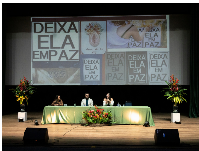
Conferência destacou cases de sucesso no empreendedorismo

Programação foi dentro da Semana de Enfermagem, que também contou com discussões sobre o piso salarial e a importância da politização nos órgãos representativos