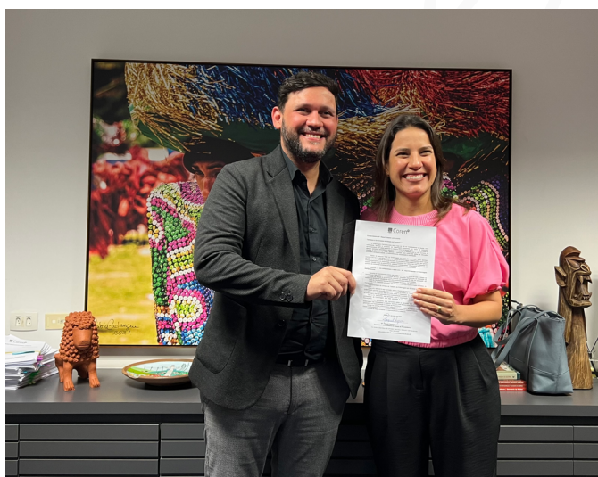
Raquel Lyra posa com carta-compromisso assinada