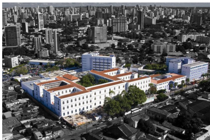
Imip funciona com subdimensionamento de profissionais de Enfermagem