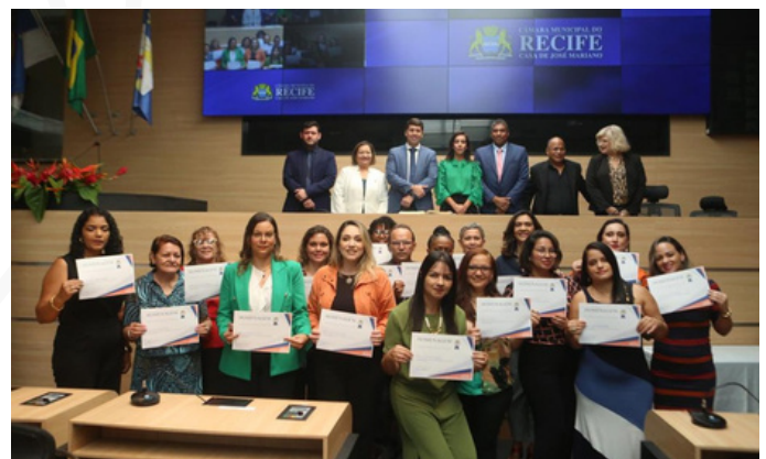
Homenagem a profissionais de Enfermagem na Câmara Municipal do Recife