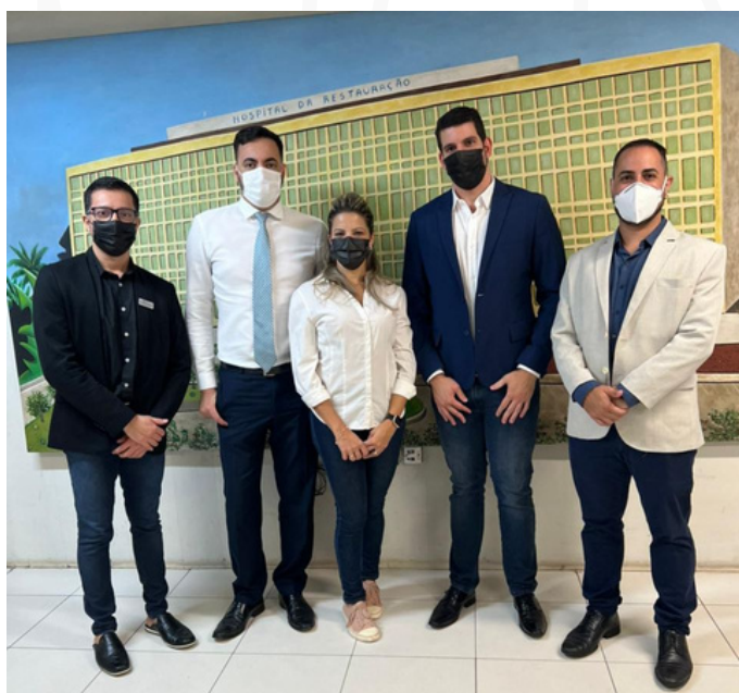
Equipe do Coren-PE realizou inspeção no Hospital da Restauração e visitou setores precários

Durante a visita no dia do incidente, os fiscais constataram vários outros pontos de infiltração, com paredes mofadas; posto de enfermagem sem condições adequadas; e local de repouso dos profissionais insalubre. Ainda em maio, um dos corredores de acesso à Emergência do HR foi tomado por água suja. Nos dois episódios, ninguém ficou ferido.