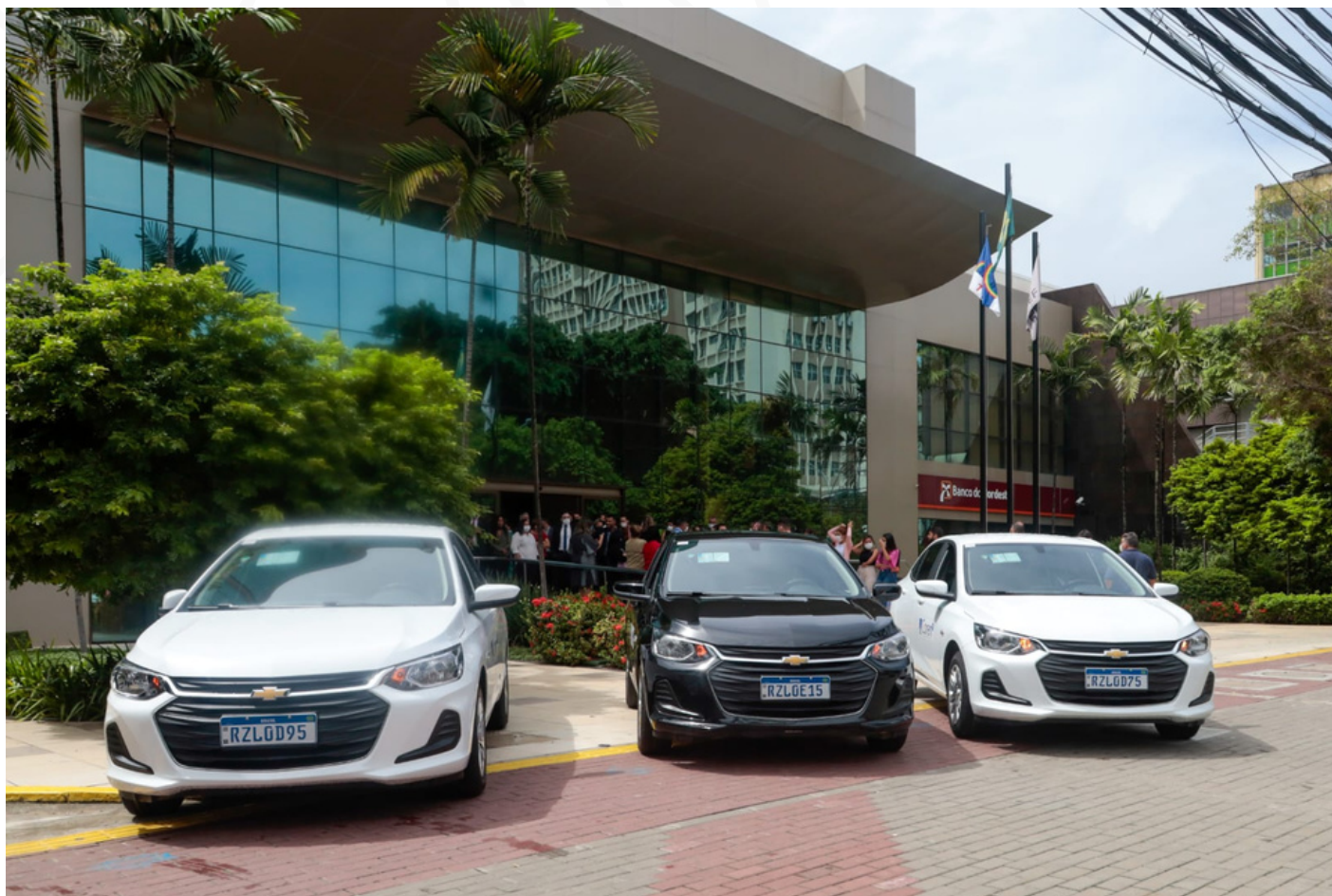
Nova frota permitirá ampliar as ações de fiscalização, fortalecendo o exercício profissional da Enfermagem

Os carros antigos do Coren-PE, que estavam deteriorados, foram leiloados em um processo de desfazimento.