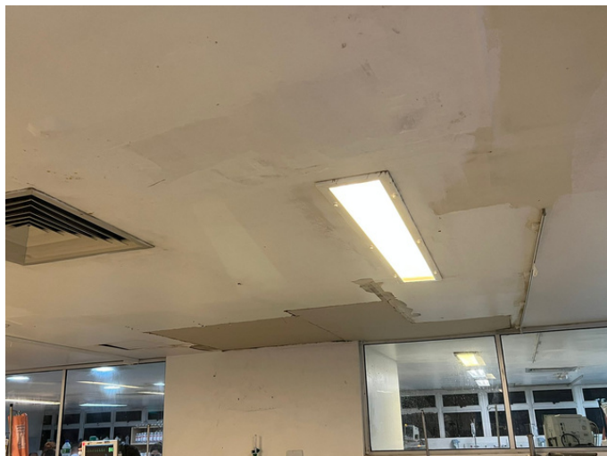
Teto com reparo recente

O relatório elaborado pelo Departamento de Fiscalização do Conselho, com todas as irregularidades, foi encaminhado para o Ministério Público de Pernambuco, Ministério Público do Trabalho e Agência Pernambucana de Vigilância Sanitária. Além disso, o documento vai analisar o processo de interdição ética do HR.